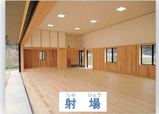
しゃ じょう 射 場

国体競技でありながら府中・南部に施設のない遠的弓道場を、山城総合運動公園に新設しました。 京都府では、「京都スポーツヒル構想」に基づき、山城総合運動公園が幅広い府民の皆様のスポーツ活動拠点となることを目指し、様々な整備を進めています。