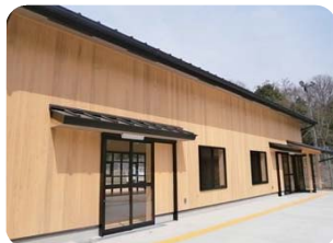
■ 射場内外壁：杉板張り