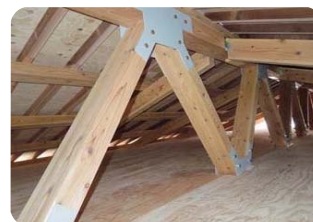
■ 屋根裏・壁内部：木材を利用した構造