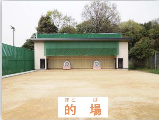
まど ば 的 場