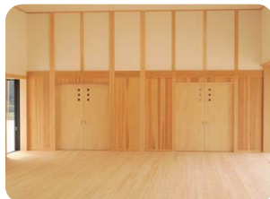
■ 射場 床：ひのき板張り 柱：ひのき